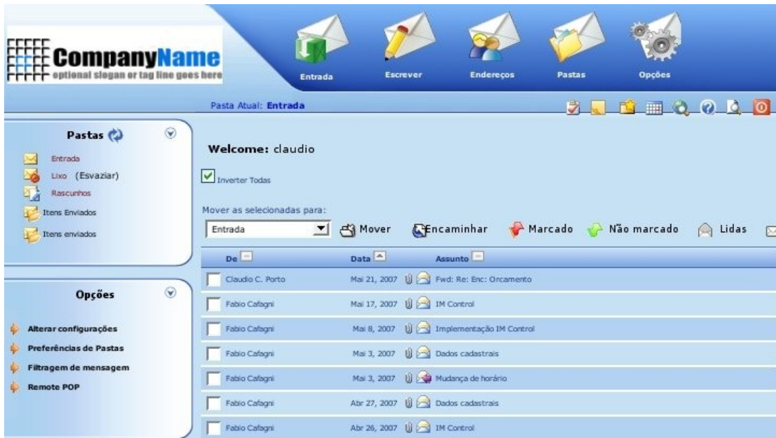
Figura 2 – Tela inicial, mostrando os principais menus e a lista de mensagens recebidas.