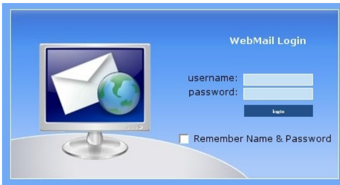
Figura 1 – Tela de autenticação. O usuário é obrigado a autenticar-se antes de ler suas mensagens.