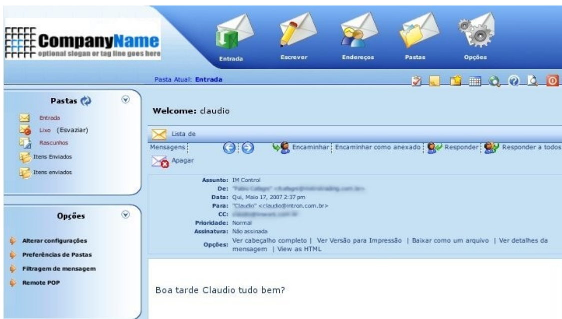
Figura 3 - Tela para leitura de e-mails.